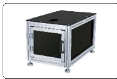
硬度计工作台(选配)